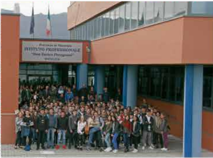
IPSIA "E. Rosa" sede coordinata di San Severino Marche indirizzi: Meccanico - Servizi per la sanità e l'assistenza sociale